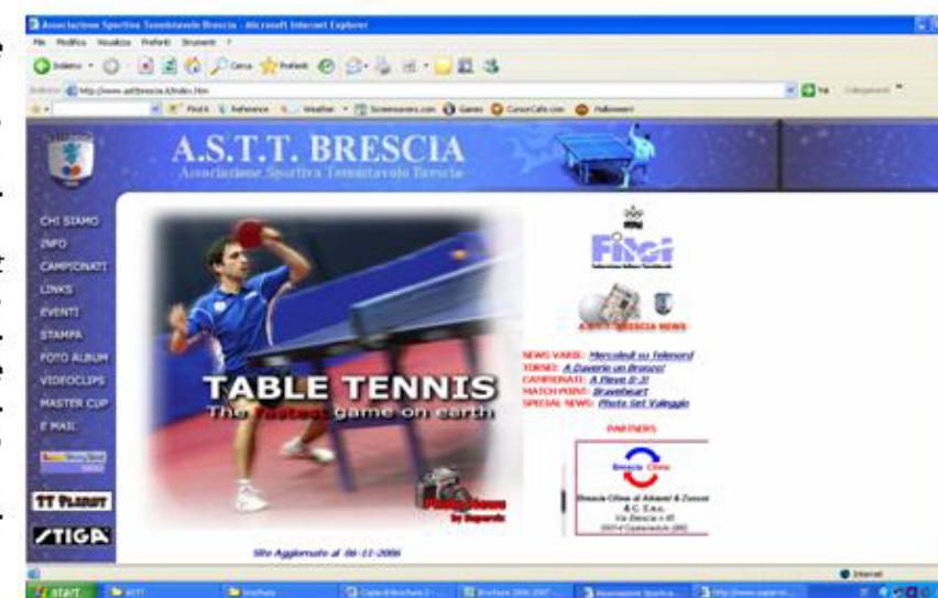
La home page del sito

Un sito accattivante e sempre aggiornato: in poche parole, un riferimento nel panorama del tennistavolo nazionale! Su www.asttbrescia.it ci sono notizie, fotografie, commenti sull'attività societaria e tanti link utili. Mandarci una e-mail è semplice: il nostro indirizzo è: asttbrescia@asttbrescia.it