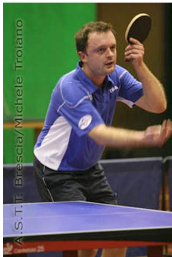
Srdan Milicevic titolare della nazionale bosniaca